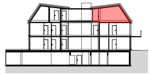
SCHNITT M 1:500