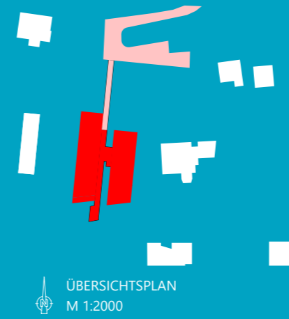
ÜBERSICHTSPLAN M 1:2000