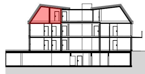
SCHNITT M 1:500