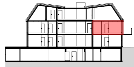
SCHNITT M 1:500