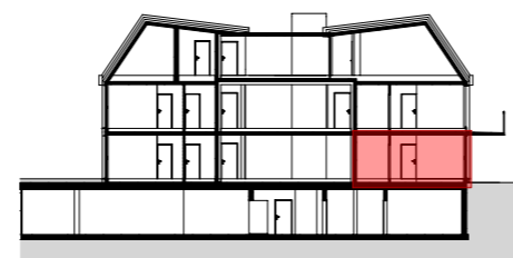
SCHNITT M 1:500