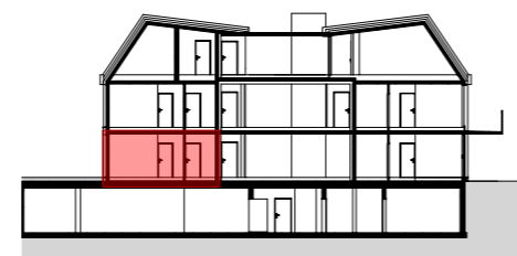
SCHNITT M 1:500