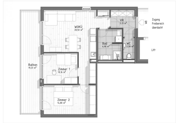
GB7 - Top 8