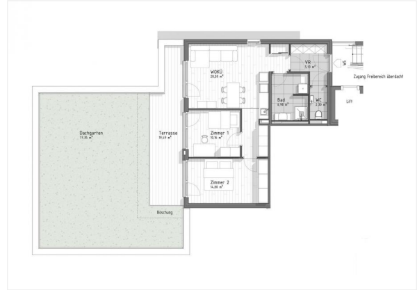
GB7 - Top 5