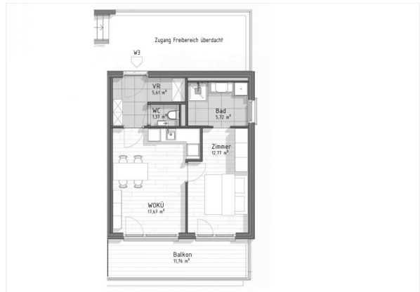
GB7 - Top 3