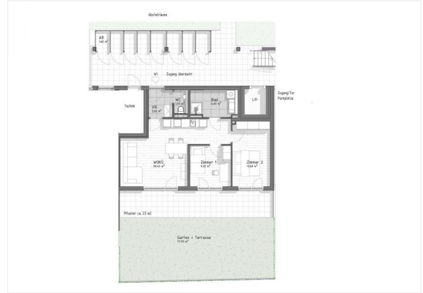
GB7 - Top 1