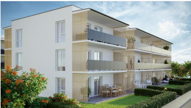
Wohnpark Primelweg Ansicht 2