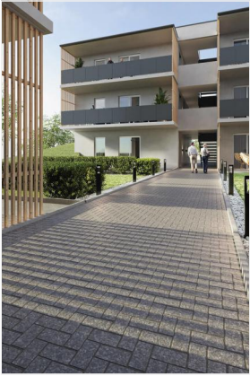
Wohnpark Primelweg Ansicht 4