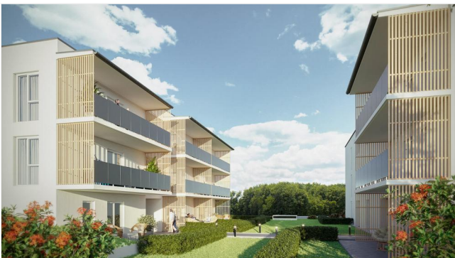
Wohnpark Primelweg Ansicht 5