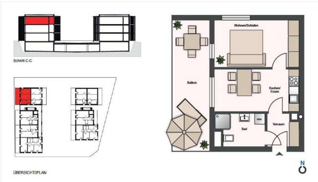
Plan Top 2.11 - PW1