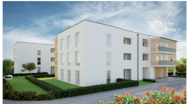
Wohnpark Primelweg Ansicht 3