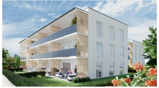
Wohnpark Primelweg Ansicht 1