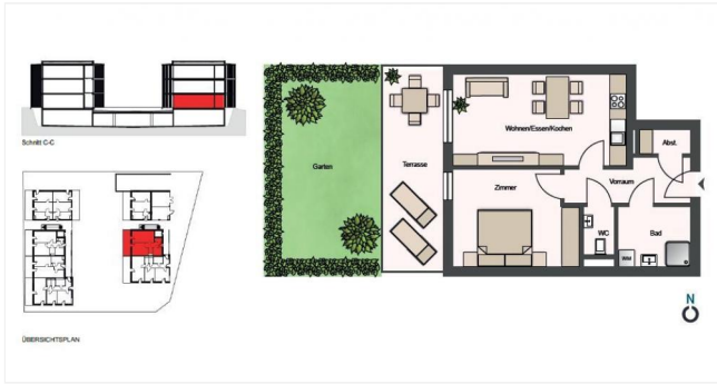
Plan Top 1.2 - PW1