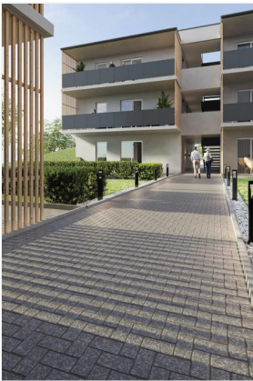
Wohnpark Primelweg Ansicht 6