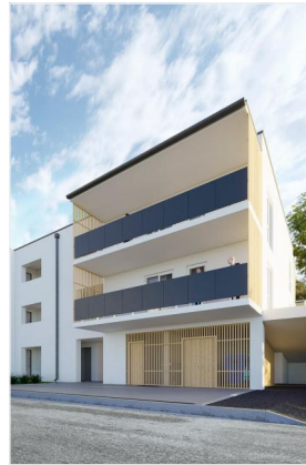
Wohnpark Primelweg Ansicht 5